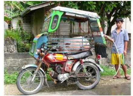
Pig in a Tricab